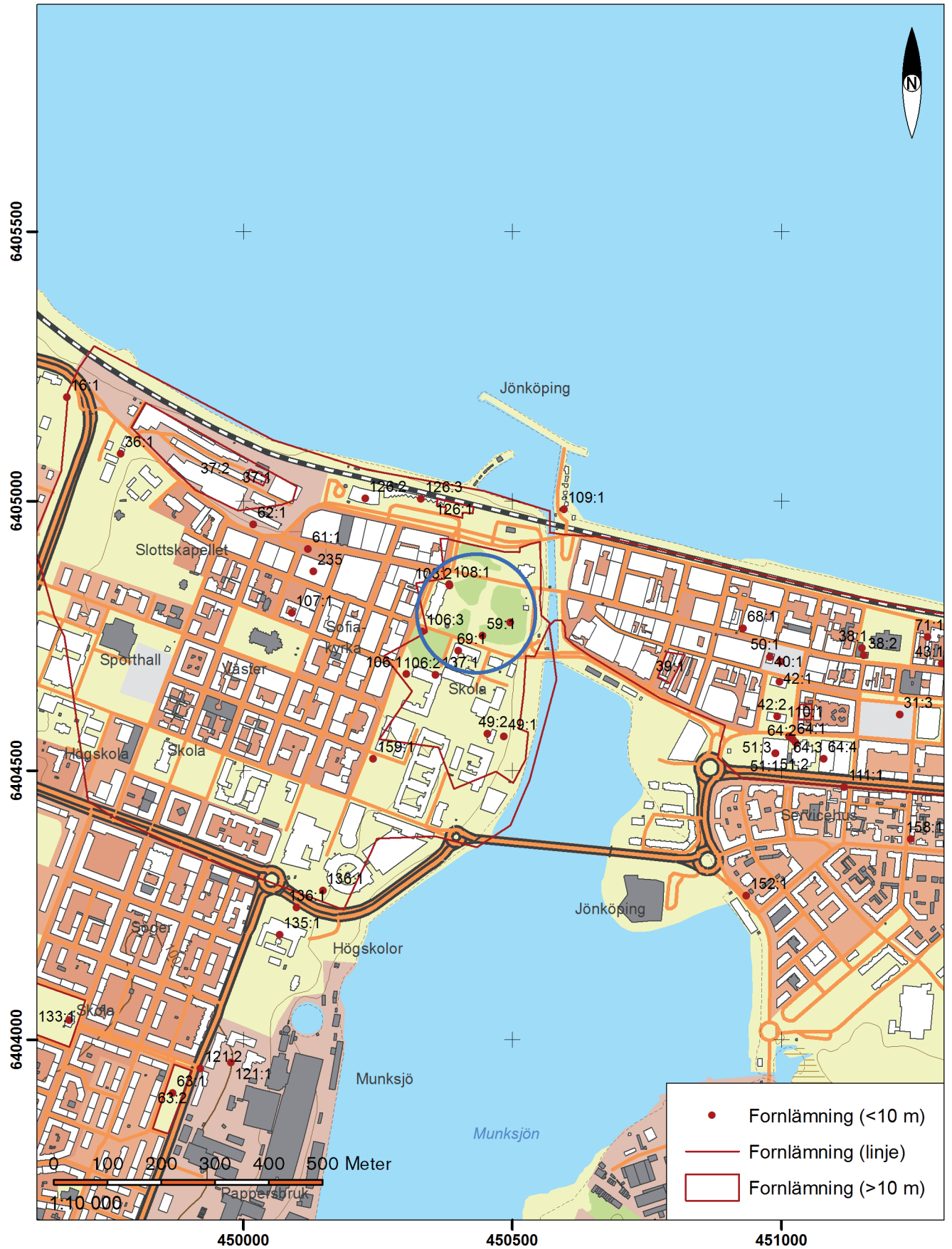
Karta med undersökningsområdet markerat med en blå cirkel. Skala 1:10 000.