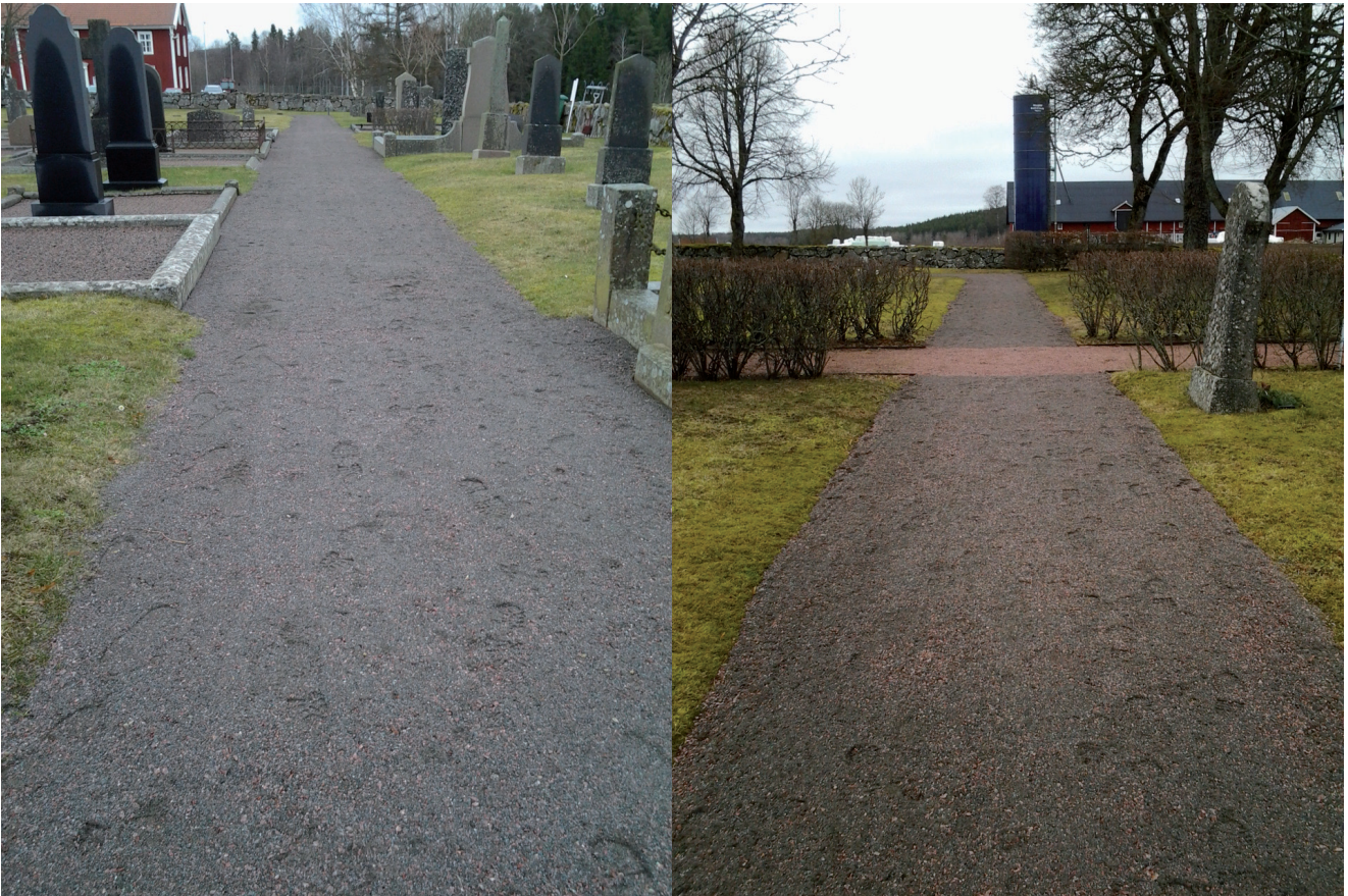
Efter arbetet. Gångar hårdjorda med yta av stenmjöl från Ubbarp med blågrå kulör som avviker från den röda på sedan tidigare hårdjorda gångar.