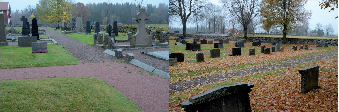
Före arbetet. Till vänster i förgrunden syns sedan tidigare hårdjord gång med rödaktigt stenmjöl från Linderås. Övriga gångar har singel.