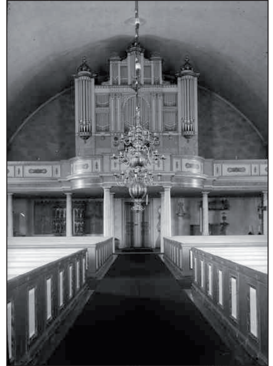
Läktaren i Flisby kyrka enligt ett fotografi från 1938.

Flisby kyrka uppfördes 1850-53 efter ritningar som bearbetats av arkitekt J A Hawerman vid Överintendentsämbetet. Den ursprungliga, slutna bänkinredningen är bevarad, med vissa undantag.