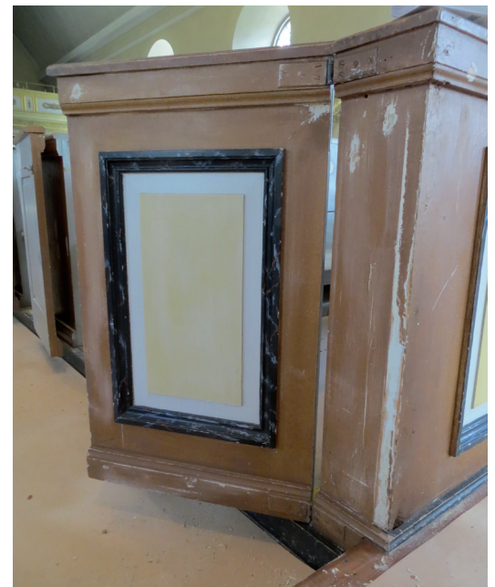
Bänkarnas målning var sliten och oenhetlig