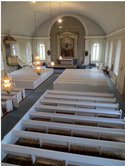
Kyrkorummet efter det att bänkarna målats om.

På den främsta bänkens insida, över psalmbokshyllan, fanns spår efter en bänknumrering. Det beslutades att en bänknumrering åter målas på samma ställe. Målningen skedde på frihand, ej som schablonmålning. Kulören fick bli densamma som bänksocklarna, NCS S 7500-N.