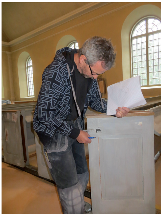
Inför ommålningen justerades bänkdörrarna så att de gick att stänga på ett enkelt sätt. Reglarna rengjordes så att de inte hakar upp sig. Vid demonteringen av gångjärn, regler eller andra beslag återanvändes befintliga spårskruvar.