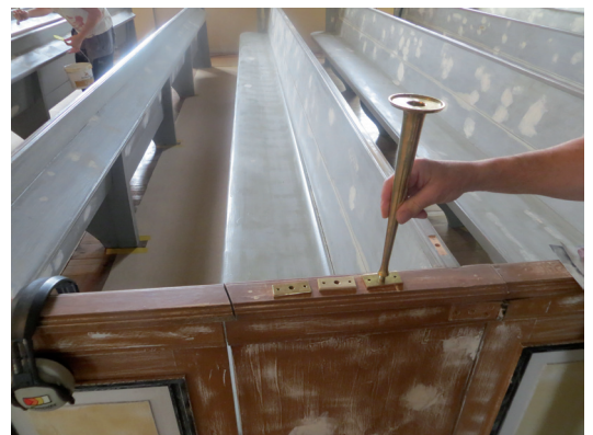
Endast två ljushållare monterades på varje bänk - en nära sido- respektive mittgången.