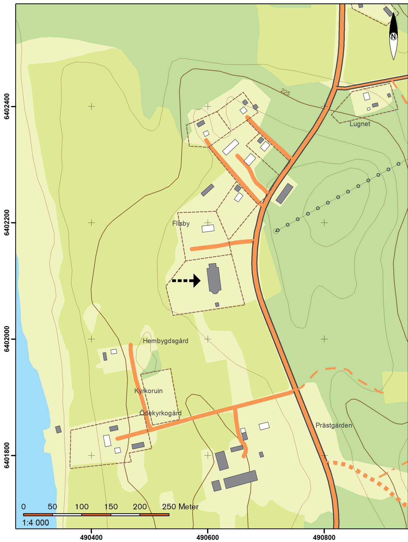
Utdrag ur digitala fastighetskartans blad 64E 0jS.