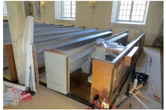
Demontering av delar av en bänk pågår för att ordna utrymmet för mixerbord m.m.

Bänkkvarteren ligger något upphöjda och begränsas med en list som tidigare var svartmålad. Listen kom nu att målas i en något ljusare mörkgrå kulör, NCS S 7500-N.