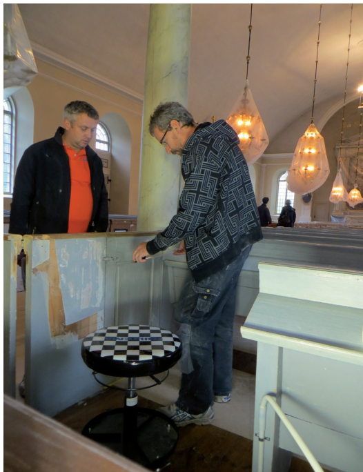
En mer ändamålsenlig plats för mixerbord m.m. skapades genom att ett bås avskärmades i det nordvästra bänkkvarterets nordöstra hörn. Detta gjordes genom att en del av bänkens rygg och sits närmast mittgången demonterades.