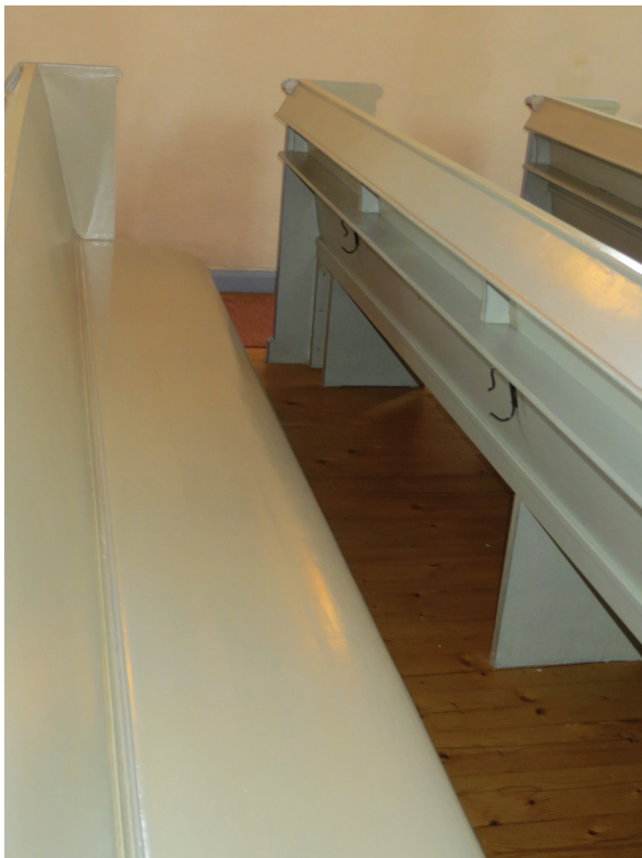
I bänkkvarteren målades bänksitsarna om i sin helhet. Underliggande bredspackling ersattes med en ny av latexbaserat spackel. Detta är ett mer elastiskt spackel med mindre benägenhet att spjälka. Psalmbokshyllor och ryggar bättringsmålades. Linoljelasyr bröts fram som kulörmässigt överensstämmer med den befintliga färgen. Bänkarna skyddsbehandlades med alkydoljefernissa.