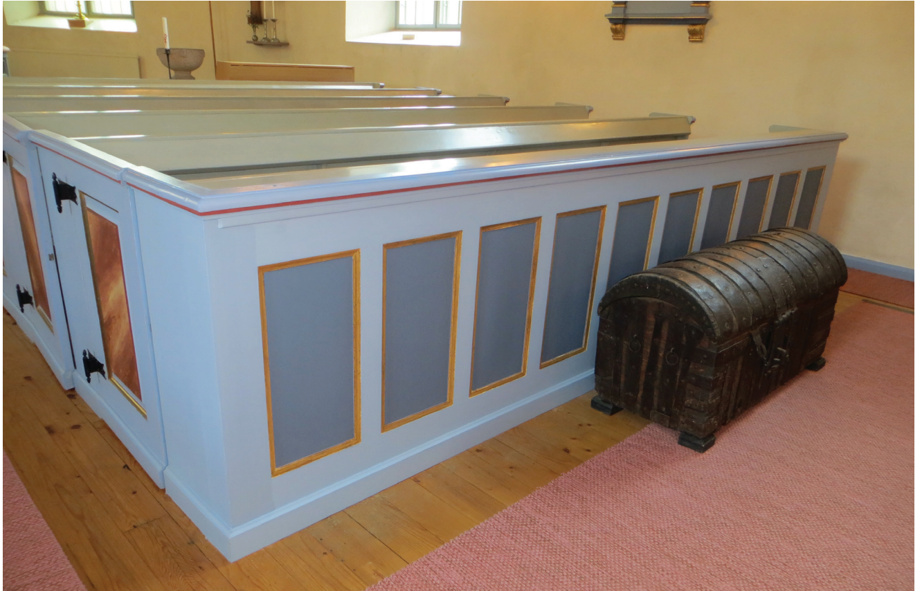
De främre bänkfronterna målades om i sin helhet, undantaget de bronserade fyllnadslisterna, medan endast spegelfyllningarna målades på de bakre fronterna.