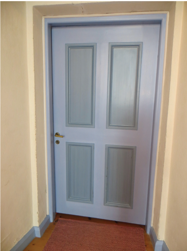
Dörrarna mot sakristian och vapenhuset målades om i sin helhet på insidan.