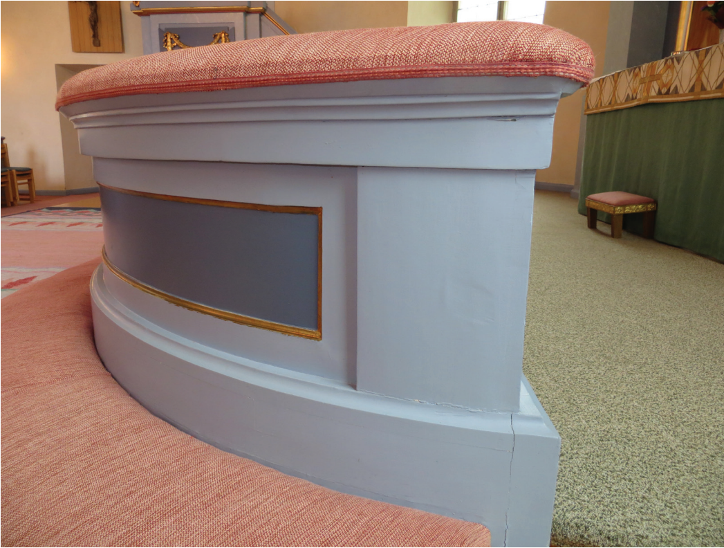
Altarringen bättringsmålades med alkydoljefärg.