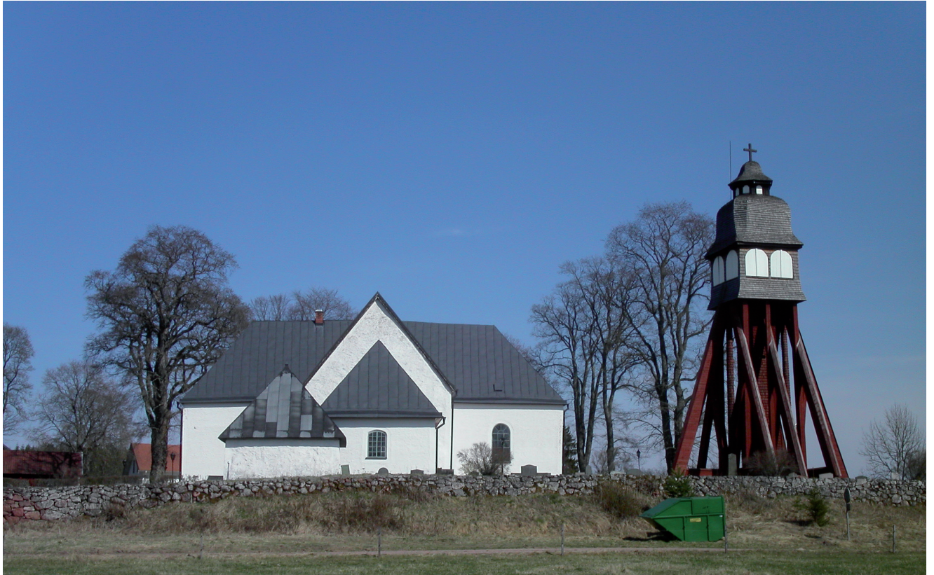
Askeryds kyrka och gravkapell från väster, fotograferade 2004. Redan då var färgen på gravkapellets plåttak till stor del försvunnen åt väster.