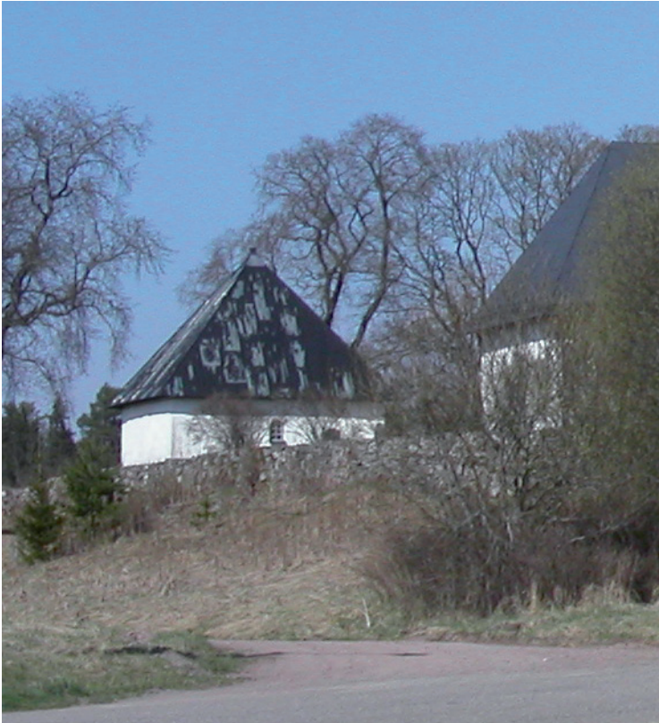
Gravkapellet från sydväst 2004.

tak, puts, måleri gjordes i enlighet med kyrkobyggnaden (ATA). Tydligt lades då ny takplåt. Den gamla täckningen var gjord med enkelfalsning och utan förskjutna hakfalsar enligt ett fotografi från 1937 (samma gällde för kyrkan). Den nya plåt som lades på kyrkan 1976 kallades för "Plaganplåt". Fasaderna putsades och kalkströks. Troligen har takplåten ommålats senast när kyrkans tak ommålades 1994 med Isotrol.