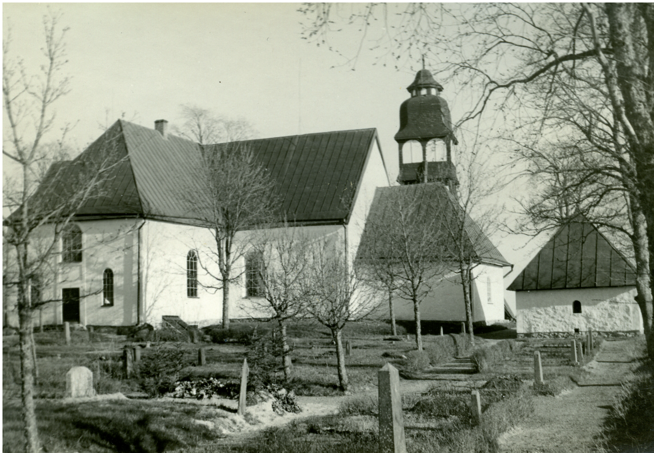
Kyrka och gravkapell på fotografi från norr 1937. Båda byggnaderna har en täckning av svartmålad järnplåt, troligen från sent 1800-tal med enkelfals och jämna hakfalsar. Notera att gravkapellet har slätputsade hörnomfattningar.