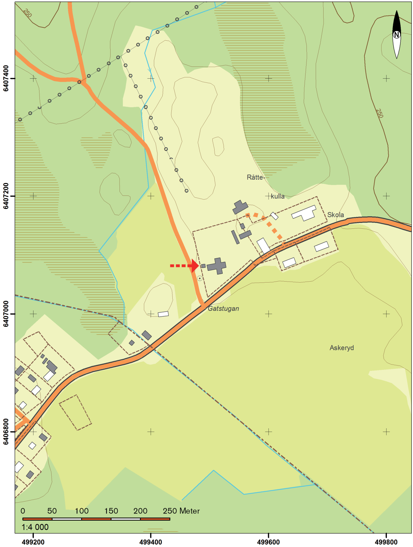
Utdrag ur digitala fastighetskartan blad 64E 0jN.