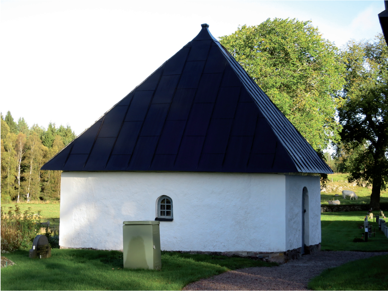
Gravkapellet från söder efter ommålning av tak och avfärgning av fasader.