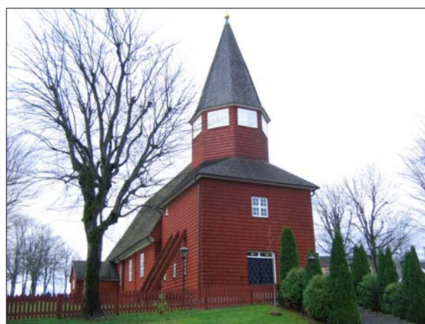
Västfasaden med tornet i den utformning som det fick efter 1953.

Bondstorps kyrka har en enskeppig planform med östvästlig orientering. I väster är ett torn vidbyggt kyrkobyggnaden och i norr är sakristian belägen. Stommen är timrad och spånbeklädd till sina fasader och takytor. Fönsteröppningarna är tätspröjsade med rektangulär form, fönstersnickerierna är vitmålade. Det finns två entréer till kyrkan, en direktentré till sakristian samt den västliga huvudentrén genom tornet. De är panelklädda och tjärstrukna, tornentrén är försett med ett mindre överljus. Foder, och taksprång är vitmålade lika som fönstersnickerierna. Tornet har formen av en inbyggd klockstapel med inklädda stödben. Tornbyggnaden kröns av en spetsig spira, ljudöppningarna är panelklädda och vitmålade.