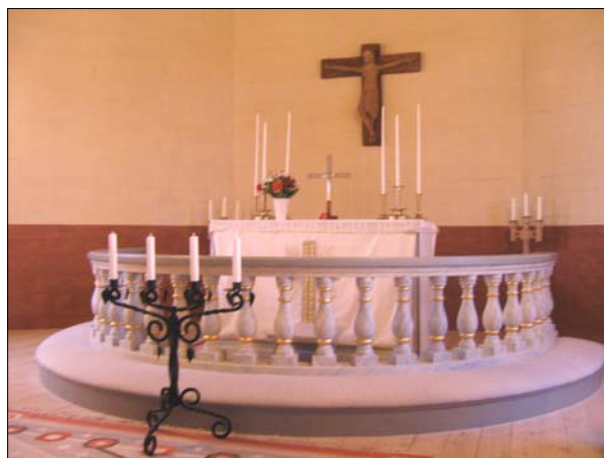
Översta bilden visar en vy mot koret. Och den nedre är en detaljbild över altaret.