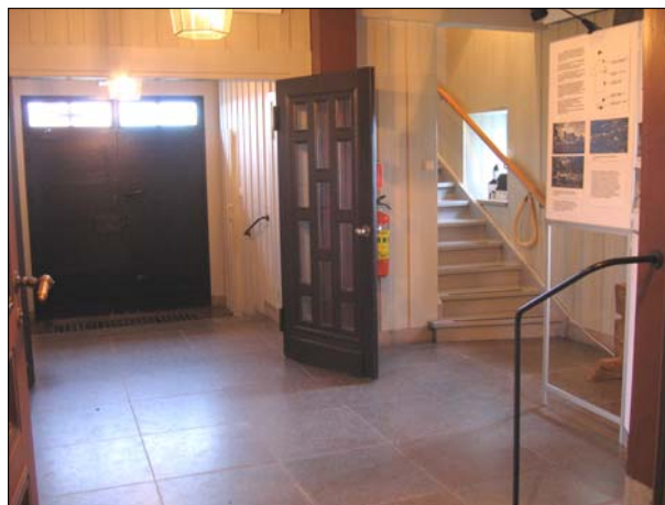
Vy över vapenhuset mot trappan till tornet och orgelläktaren.

Sakristian har ett trägolv och är disponerad med ett förrum mot kyrkorummet varifrån trappan till predikstolen går. Väggarna utgörs av synligt timmer som målats i grått. Taket är klätt med panel målat lika som väggarna. Dörrarna utgörs av gråmålade fyllningsdörrar.