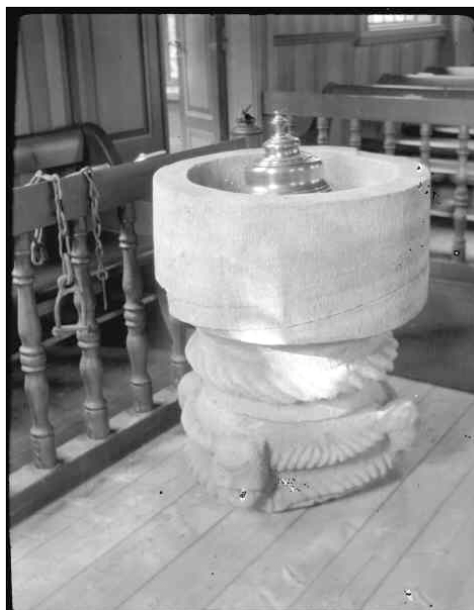
Dopfunten av sandsten, äldre medeltid. I bakgrunden syns den öppna bänkinredningen som tillkom vid 1890 års restaurering.