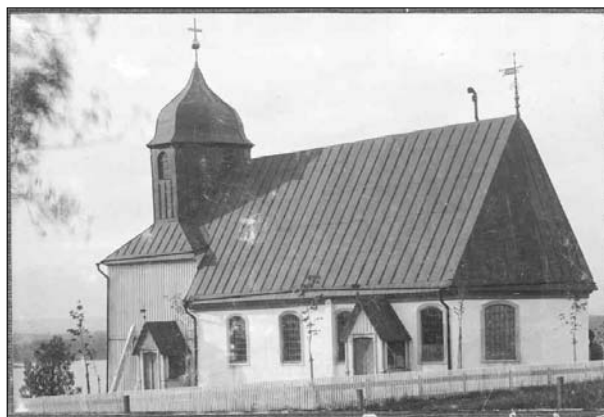
Kyrkan från söder innan omdaning 1953. Foto P A Eriksen okänt datum. (ATA)

Tornkammaren nås från vapenhuset och fungerar idag som samlingsrum och textilförvaring. Golvet är ett gråmålat trägolv och väggarna är panelklädda och målade i grått lika som golvet. I taket sitter rödmålad panel. I tornkammaren är en äldre altarmålning och orgelfasad monterad som dekorativa element. I tornet finns rester av den ursprungliga spånbeklädnaden bevarad på gavelröstet mellan kyrkorummet och tornet. Interiören i tornet präglas av obehandlade trätytor. I tornet förvaras ett flertal äldre detaljer såsom skulpturer och delar av äldre inredning.