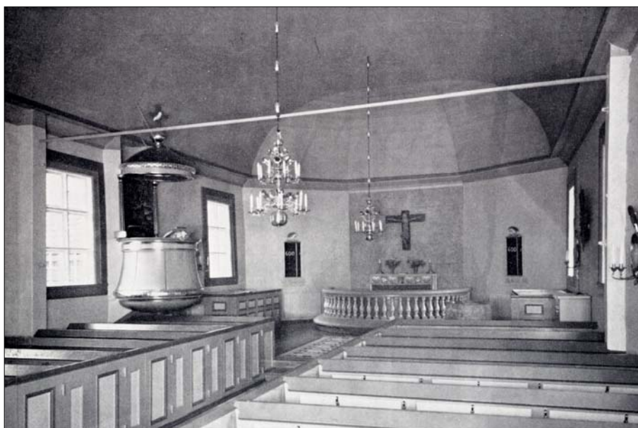
Kyrkorummet som det tog sig uttryck efter restaureringen på 1950-talet. (JLM)

1987-88 gjordes en utvärdig restaurering under ledning av Sven Samuelssons Byggnadsfirma i Tranås. Arbetena omfattade både fasad- och målningsarbeten. När kyrkan åter spånbekläts under 1950-talet hade utförandet haft sådana brister att delar av täckningen nu behövde ersättas. På långskeppet och absidens takytor lades ny spånbeläggning, i övrigt gjordes enbart kompletteringar av den befintliga spåntäckningen. Snickerierna rengjordes och målades med linoljefärg. Den utvärdiga restaureringen följdes i mitten av 1990-talet av en genomgripande inre restaurering som syftade att förstärka kyrkorummets 1700-talsuttryck.