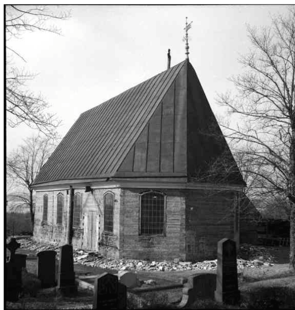
Kyrkan från sydöst. Tornet nedtaget, reveteringen avlägsnad. Under restaurering 1953.

Invändigt önskade Erichs att rensa kyrkorummet från all inredning men detta bromsades av myndigheterna. Den öppna bänkinredningen plockades bort och timmerväggarna frilades från pärlspåntpanelen. En ny sluten bänkinredning utfördes med enkla fyllningar utan dekorationer. I koret plockades altartavlan ned och det medeltida krucifixet monterades som altarprydnad efter att det konserverats av konservator Sven Wahlgren. Under arbetena i kyrkan påträffades dekorativ måleri från 1700-talet på läktarbröstningen vilket plockades fram, den gamla orgeln dömdes ut och en ny tillverkades av den danska orgelfirman Fredriksborgs Orgelbyggeri. Kyrkan moderniserades även genom att elektrisk belysning och värme installerades.