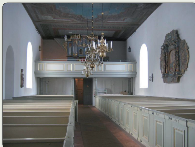
Interiörbild från Bredestads kyrka. På läktaren står orgeln från början av 1750-talet och på väggen till höger hänger den tidigare altartavlan.

År 2009 gjordes arkeologiska undersökningar invid kyrkan. Anledningen var att man skulle lägga ned ny dränering. Undersökningarna visade sig kunna bidra med ytterligare intressant kyrkohistoria – parallellt med den norra långhusmuren låg en ca 15 meter lång stengrund som troligtvis tillhört en äldre stavkyrka av trä. Antagligen kan denna dateras till 1000- eller 1100-talen.